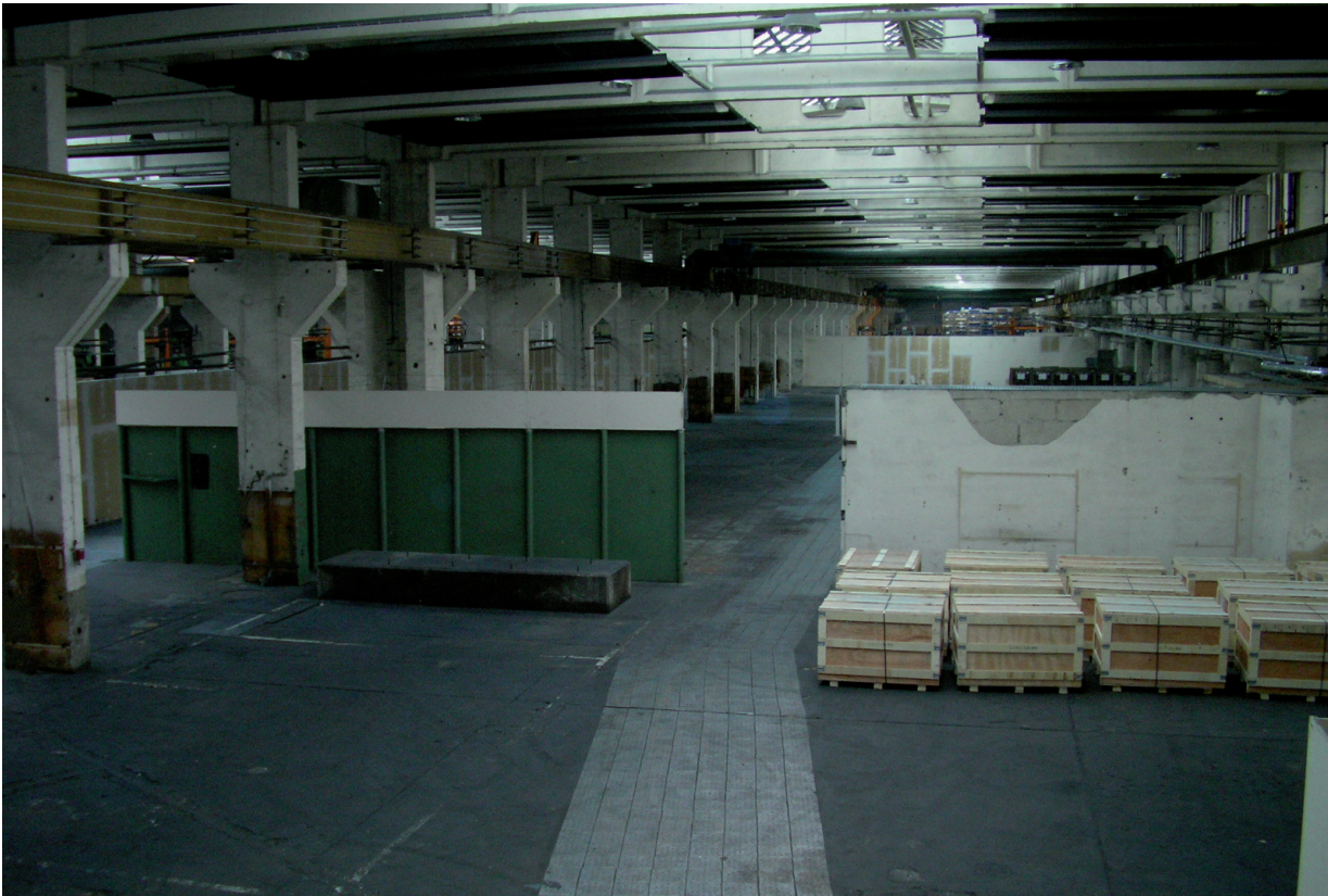
Bild 3- Innenansicht