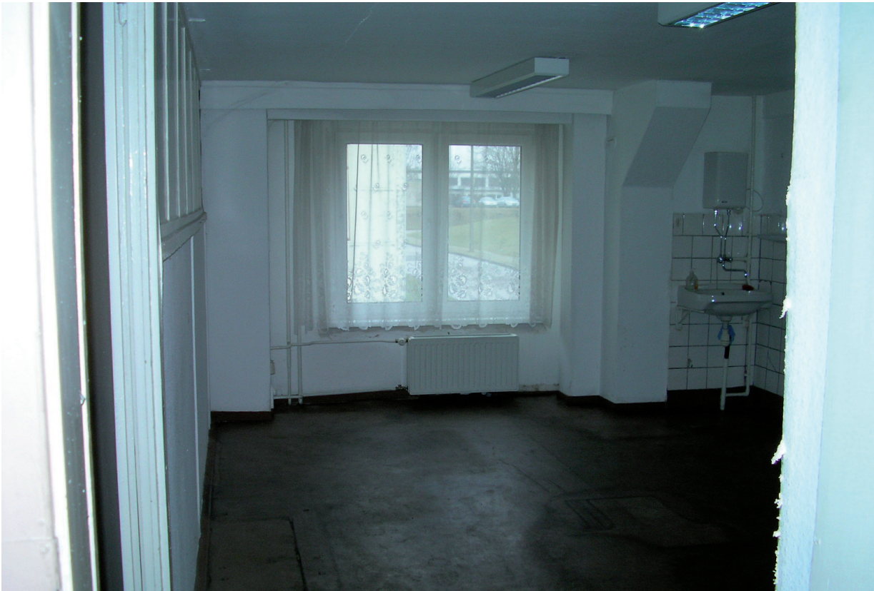
Bild 5- Büro Verwaltung Innenansicht