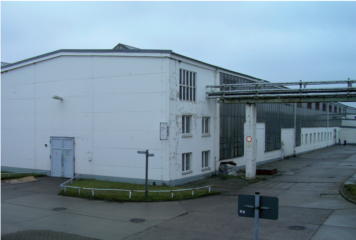
Bild 1- Hallenansicht süd