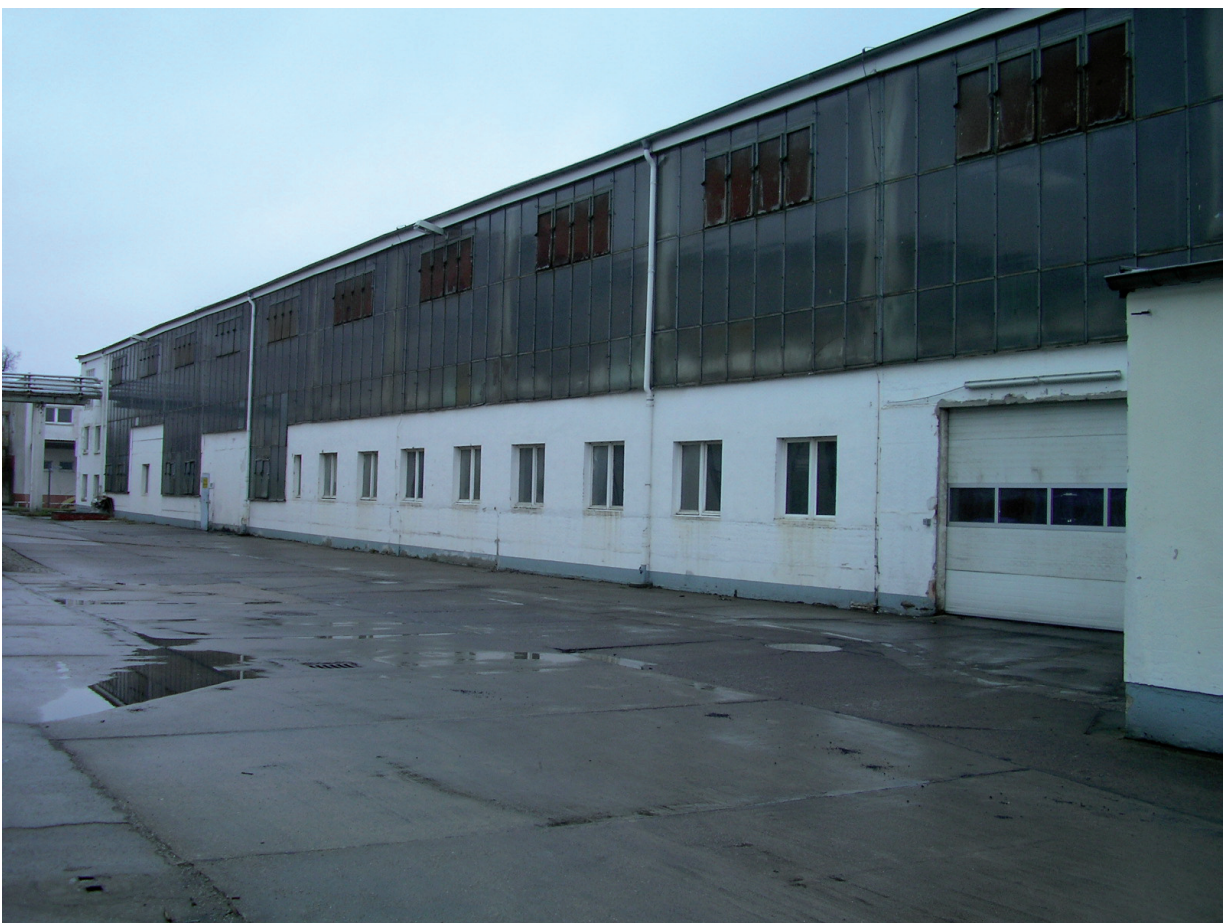
Bild 2- Hallenansicht ost