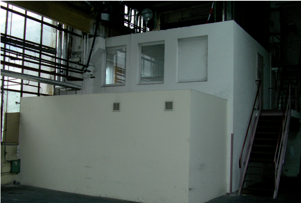
Bild 4- Büro Verwaltung