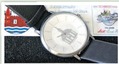
Die Uhr gibt es wahlweise mit Leder- oder Metallarmband.

Juwelier Born, in der Tourist-Information und bei der Stadt Schwedt/Oder im Rathaus Haus 2. Alle Uhren sind nummeriert. Wer eine ganz spezielle Nummer verschenken möchte, sollte sich vorab erkundigen, ob es die gewünschte Nummer noch gibt und an welcher Stelle. Viele Nummern sind bereits vergriffen oder für den Verkauf vorgemerkt. Die Nummern 1 bis 100 verkauft die Stadt Schwedt/Oder selbst. Die Hälfte dieser Uhren hat bereits ihre Träger gefunden. Von den einstelligen Nummern ist im Moment nur noch die Nummer 9 erhältlich. Die besonderen Nummern 50 und 100 sind natürlich längst vergeben. Aber wie wäre es mit der 25? Oder haben Sie 84 geheiratet? Haben Sie eine besondere Beziehung zur Nummer 13? Während der üblichen Sprechzeiten kann in der Dr.-Theodor-Neubauer-Straße 5 die Jubiläumsuhr für 79,90 Euro in einer edlen Verpackung erworben werden. (öa)