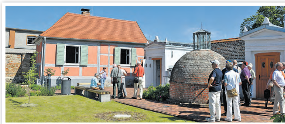
Zum internationalen Museumstag am 16. Mai findet das Gartenfest am Bauensemble statt.