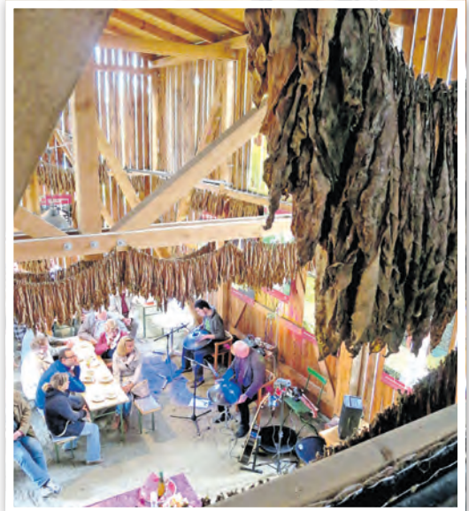
Dekoratives Trocknen von Tabakblättern in der Tabaktrockenscheune auf dem Gelände, die für Veranstaltungen genutzt wird.

schichte der Stadt bekannt zu machen. Schauvorführungen rund um den Tabak gehören ebenso wie Livemusik und Tanz zum Programm. Aber auch die „Tabaksköst“ als spezielle Form des Erntedankes