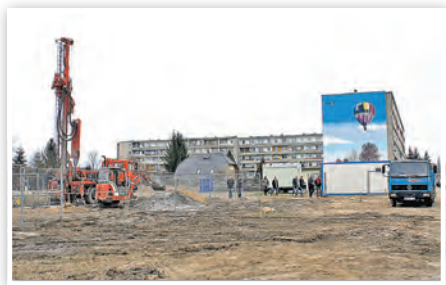
Bis 2013 standen hier zwei Plattenbauten der Wohnbauten GmbH.

» Seit Anfang März rollen wieder Bagger und Baufahrzeuge in das Wohngebiet Gatower Straße. Weniger um den Rückbau weiterzuverfolgen – 2013 wurde hier der Straßenzug Gatower Straße 1–25 abgerissen –, sondern um Fundamentgräben für sechs neue Mehrfamilienhäuser auszuheben. Die Wohnbauten Schwedt GmbH verfol-