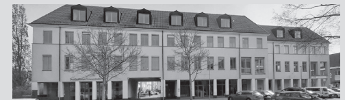
Außenstelle , Dr.-Th.-Neubauer-Straße 24