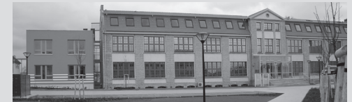
Alte Fabrik , Dr.-Th.-Neubauer-Straße 12