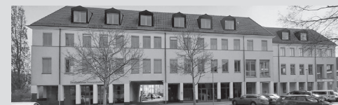
Außenstelle , Dr.-Th.-Neubauer-Straße 24

Postanschrift: Stadt Schwedt/Oder Dr.-Th.-Neubauer-Str. 5 16303 Schwedt/Oder