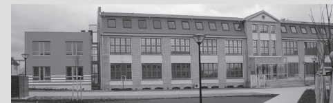
Alte Fabrik , Dr.-Th.-Neubauer-Straße 12