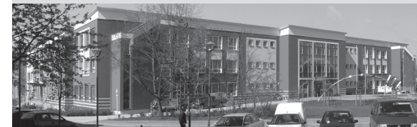
Rathaus , Dr.-Theodor-Neubauer-Straße 5