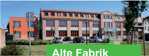
Alte Fabrik Dr.-Th.-Neubauer-Straße 12