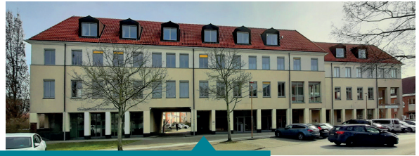
Außenstelle Dr.-Th.-Neubauer-Straße 24