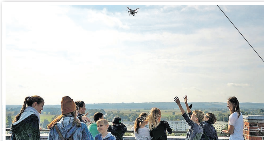
Dreharbeiten auf dem Kirchturm der evangelischen Kirche.

» Im September waren erstmalig die „Stadtentdecker“ der Klasse 6a der Grundschule „Bertolt Brecht“ in der Altstadt unterwegs, auf der Suche nach interessanten Drehorten für kurze Videoclips in Schwedt. Gemeinsam mit ihrer Klassenlehrerin Frau Rahn beteiligten sich die Kinder am Kooperationsprojekt „Lieblingsplätze!? – Die Stadtentdecker“ der Brandenburgischen Architektenkammer und der Bildungsinitiative „Kinder machen Kurzfilm!“, um sich spielerisch mit der städtischen Architektur zu beschäftigen. Denn gemeinsames Anliegen der Projekt-Verantwortlichen ist es, Kinder zu einer bewussten Wahrnehmung ihrer Umgebung zu motivieren. Sie anzuregen, sich mit den räumlich-baulichen Gegebenheiten ihrer Stadt konstruktiv und kritisch auseinander zu setzen, ihre gewonnene Perspektive filmisch zu präsentieren und damit an der stadtplanerischen Entwicklung teilzuhaben. Ihre Ideen und Wünsche sollen wahrgenommen und einbezogen werden. Stadtplanern und Entscheidungsträgern der Stadt sollen die Videoclips den Blick für die Sicht der Kinder öffnen, die die Stadt als nächste Generation bewohnen werden.