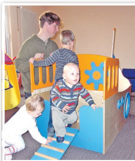
Warm und trocken, statt nass und kalt.

Im Zeitraum von November bis Ende Februar dürfen Eltern mit ihren Kindern (0–4 Jahre) ihre Samstagnachmittage dort verbringen. Eine vielfältige Ausstattung lässt Kinderherzen höher schlagen: ob es die Rollrutsche ist, das Trampolin, die Küchenecke, die Bobbycars, der Elefanten-Rüssel-Tunnel oder die großen Schaumstoffbauteile. Für jeden ist etwas dabei. Väterherzen schlagen vielleicht bei einem Kicker-Turnier höher. In der gemütlichen Sitzecke kann man das