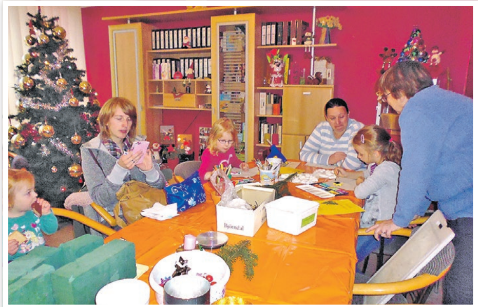
Beliebte Werke sind Weihnachtsgestecke für den Adventstisch zuhause.

Der späte Nachmittag (17:00 Uhr) gehört den Frauen im LILA Salon zum „Frauentag ist nicht im Winter“, ebenfalls mit dem Liederpoeten Bernd Pittkunings. Er beeindruckt bei seinen Live-Auftritten durch gesangliches