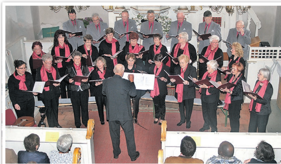
Sing- und Heimstätte des Chores Criewen ist die Criewener Kirche im Lenné-Park.

Eine besinnliche Stunde in der Vorweihnachtszeit verspricht das Konzert des Nationalpark-Chores Criewen am Samstag, dem 5. Dezember 2015, um 14:00 Uhr in der Criewener Kirche. Auf dem Programm stehen Chorsätze wie „Seht es kommt die heil'ge Zeit“, „Immanuel“, „Ihr Kinderlein kommet“, „Felize Navidad“ und viele mehr, die unter der charakteristischen Kirchenakustik besonders klangvoll zu hören sind. Eröffnet wird das Konzert mit einem Kanon von Rainer Butz „Gaudeamus hodie“. Zwischen den einzelnen Lieder-