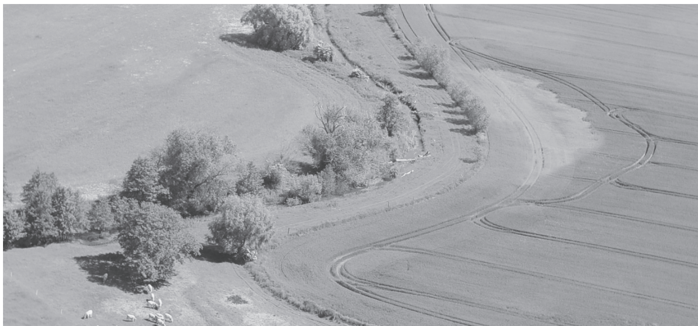
Die Welse vor Frauenhagen, Juni 2010

Für weitere Informationen besuchen Sie www.wasserundlandschaft.de