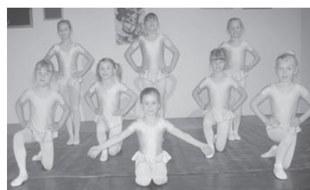
Die Musik- und Kunstschule sucht Kinder für eine neue Anfänger-Tanzklasse.

Das Amtsblatt für die Stadt Schwedt/Oder „Schwedter Rathausfenster“ erhalten Sie auch im Foyer des Rathauses und im Rathaus Haus 2.