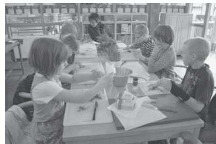
Kinder beim Herstellen von Kräuterbutter

Überraschend zeigen Kapuzinerkresse, Ringelblumen und Oregano, wie gut eine bunte Blume schmecken kann. Mit einem Kräutersträußchen, einer Rezeptsammlung, duftender Kinderseife