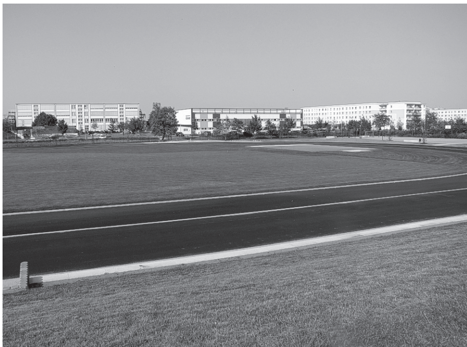
Bürger- und Sportpark Külzviertel

Alle Schwedter und Sportbegeisterten sind am 28. August, um 15:00 Uhr, im Sport- und Freizeitzentrum Dr.-W.-Külz-Viertel zur Eröffnung des Bürger- und Sportparks und einem erlebnisreichen Spiel- und Sportnachmittag herzlich eingeladen.