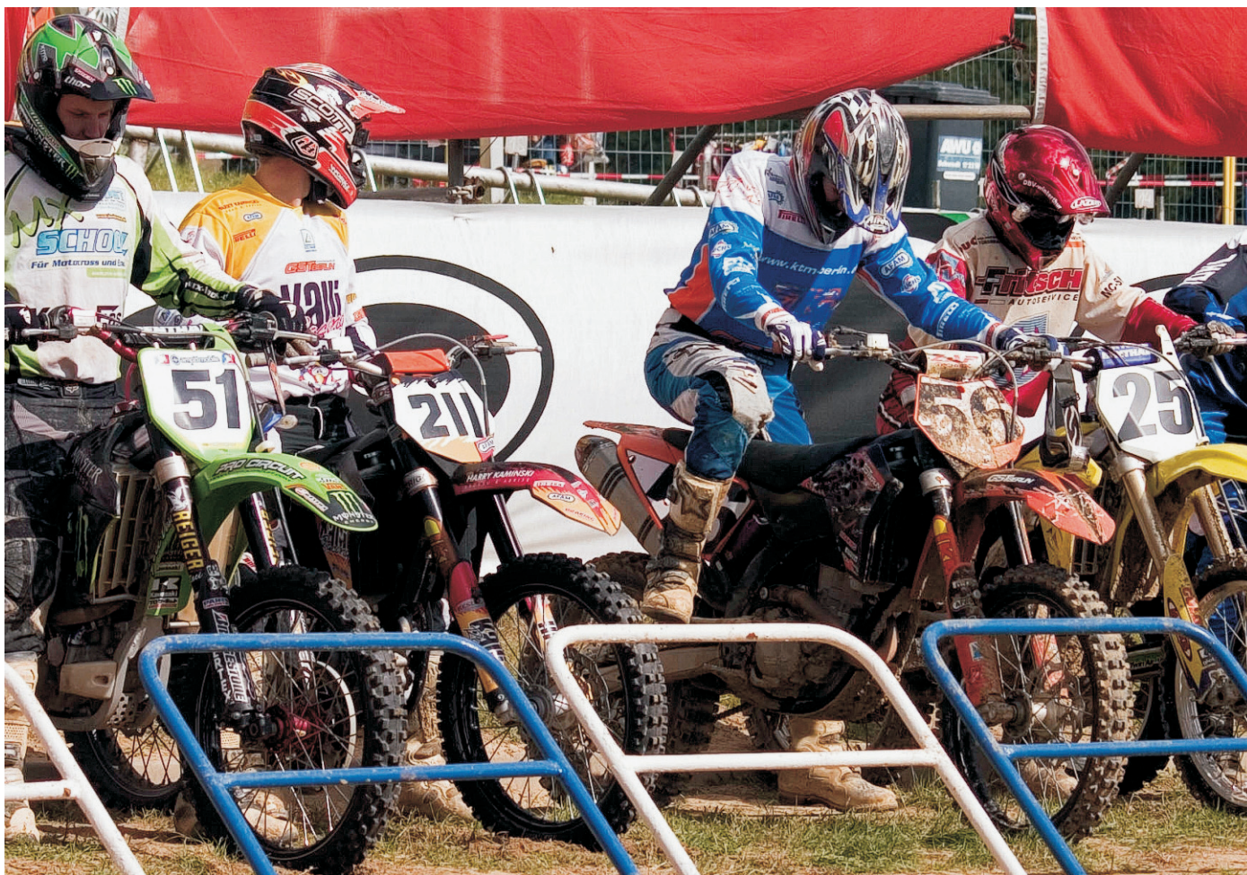
Am 1. und 2. August organisiert der Motorsportclub Schwedt e. V. den 12. Serienlauf der FIM MX3 Weltmeisterschaft sowie einen Europameisterschaftslauf im MX2 in den Blumenhagener Müllerbergen.