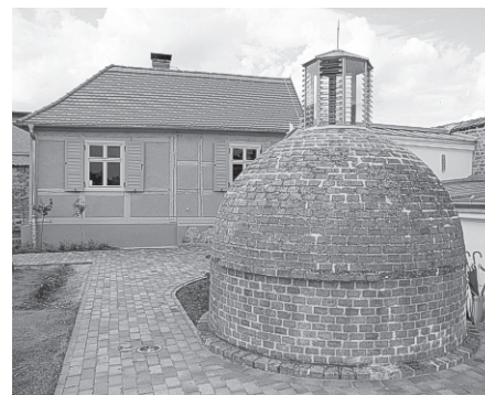
Ensemble Jüdisches Ritualbad, bestehend aus einer Mikwe und einem ehemaligen Tempeldienerhaus.