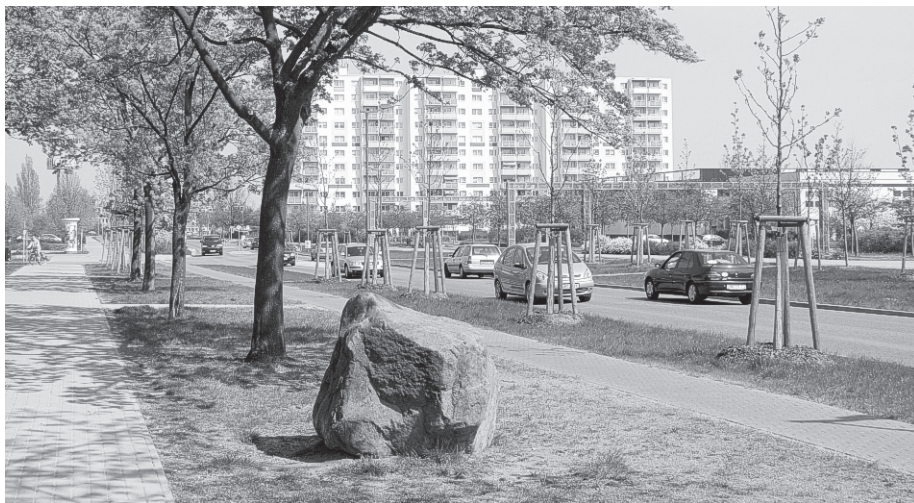
Die Umbenennung der Otto-Grotewohl-Straße in Leverkusener Straße erfolgte am 1. Januar 1993.