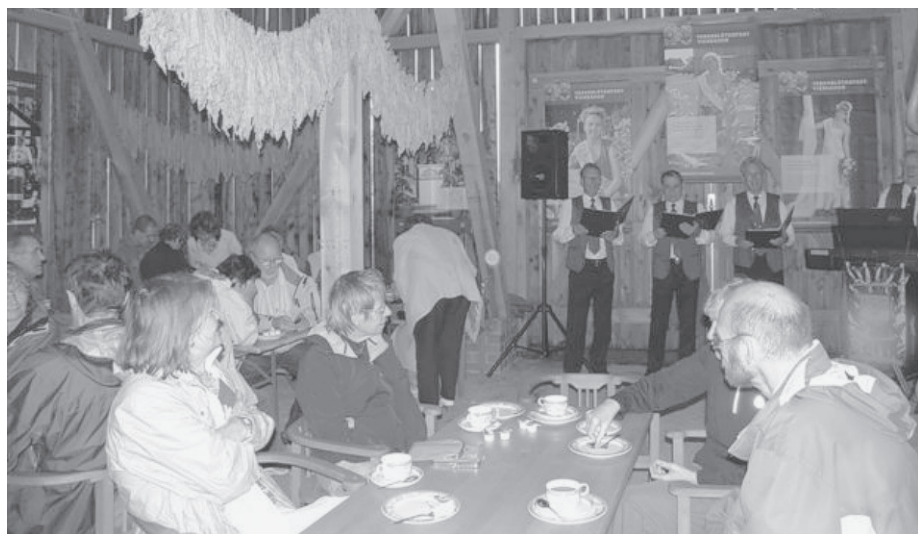
Konzert in der Scheune des Tabakmuseums

Städtische Museen Schwedt/Oder Kunower Dorfverein