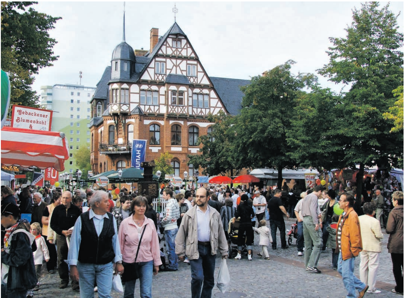
Feiern Sie im September auf einem der zahlreichen Feste wie dem Oktoberfest in Schwedt und Umgebung!