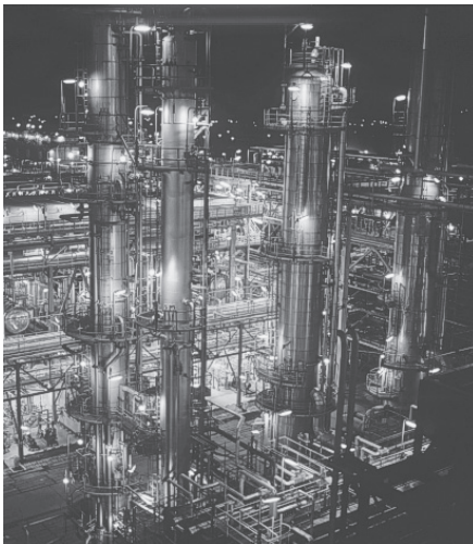
PCK by Night

In der Zeit von 17:30 bis 22:30 Uhr erwartet den interessierten Besucher ein vielfältiges Abendprogramm. Von Bus- und Werksrundfahrten über Informationsausstellungen zur Raffinerie bis hin