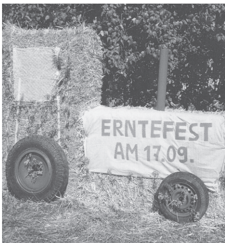
Der Strohtrecker als Erntefestmaskottchen

Am 17. September beginnt um 13:30 Uhr mit einem Umzug durchs Dorf das diesjährige Erntefest in Kummerow. Der Umzug mit Kapelle, Fußvolk und Maschinen führt dabei durch den Ort und lädt die Besucher zum Staunen ein. Traktoren aus verschiedenen Jahrzehnten (auch der Marke Eigenbau) werden hier zu sehen sein.