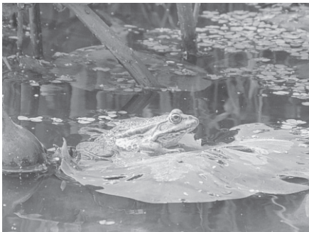
Frosch auf Seerosenblatt

Im Wettbewerb mit 23 anderen Wasserlandschaften eifert das untere Odertal um den Titel „schönstes Naturwunder Deutschlands“. Deshalb gilt für alle heimat- und naturverbundenen Barnimer und Uckermärker sowie alle Liebhaber des Nationalparks Unteres Oder-