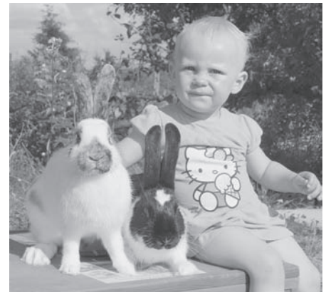
Kaninchen sind schon bei den Kleinsten beliebt

Geöffnet ist die Ausstellung am Samstag von 9:00 Uhr – 18:00 Uhr und am Sonntag von 9:00 Uhr – 13:00 Uhr. Der Eintritt für Jugendliche bis 18 Jahre ist frei und Erwachsene zahlen nur 1 €. Wer Freude an Natur und Tier hat sollte sich