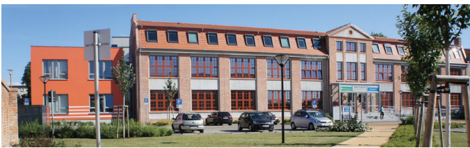
Alte Fabrik, Dr.-Th.-Neubauer-Straße 12