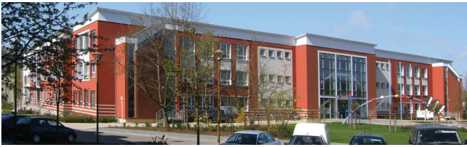
Rathaus, Dr.-Th.-Neubauer-Straße 5