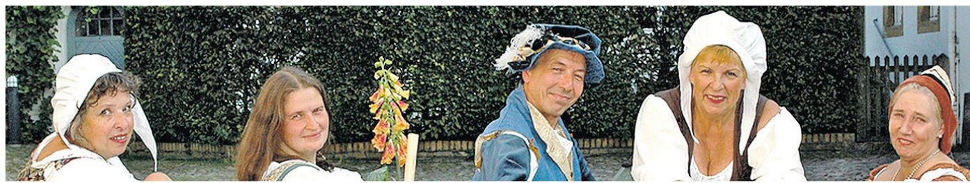
Hof-Spielleute, Schauspiel mit Musik und Tanz – Geschichte auf der Bühne