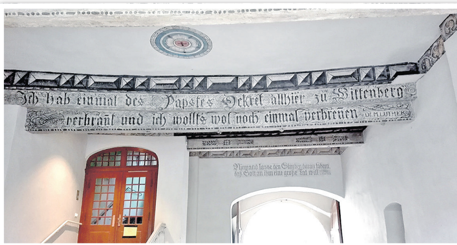
Eingang zum Lutherhaus in Wittenberg

Am Mittwoch, dem 8. März 2017, um 15 Uhr sind Eva Brummund, Liselotte