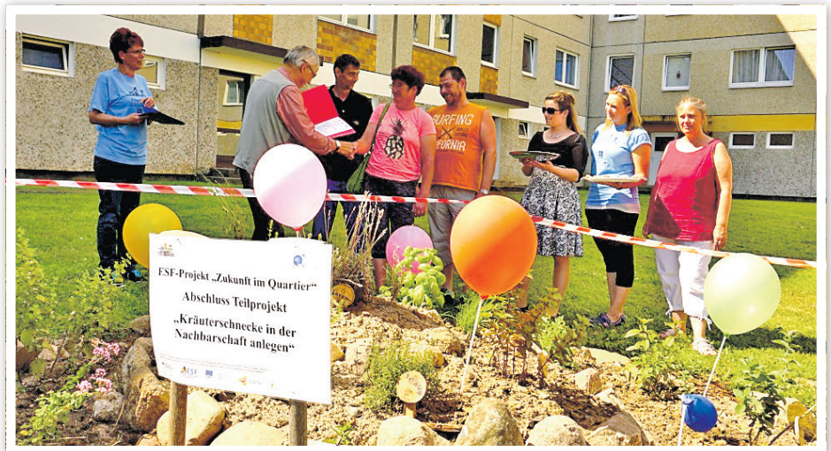
Ein Höhepunkt der Veranstaltung war die Einweihung der Kräuterschnecke.

Mal- und Bastelstraße, als auch der Spielgeräte-Parcours luden Eltern mit Kindern ein, selbst aktiv zu werden. Die einzelnen Aktionen wurden vom Organisationsteam genutzt, um über das Projekt sowie über die Chancen, die das Projekt bietet, zu informieren. Es kann