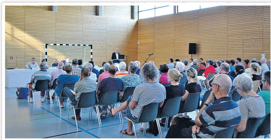
Informationsveranstaltung des BLB in der Sporthalle Criewen

Verschiedene Vorträge machten die Bedeutung der Denkmalpflege und die konkret laufenden und geplanten Pflegemaßnahmen für den Criewener Lenné-Park für das anwesende Publikum transparent. Es gilt der Grundsatz der öffentlichen Parknutzung. Um die Sicherheit der Besucher zu gewährleisten, werden temporär während einiger