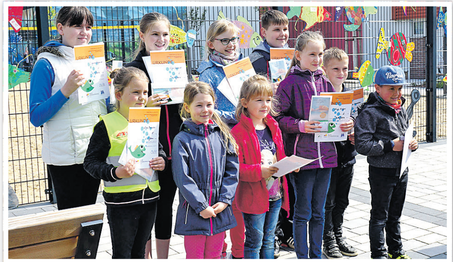
Preisträger des Wettbewerbes „Fliegende Fische“