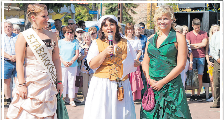
Der Auftritt der Tabakkönigin 2016.

Seien Sie herzlich eingeladen zu kulinarischen Leckerbissen, Unterhal-