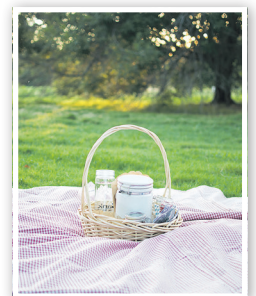
Das MehrGenerationenHaus lädt zum „Iss draußen Tag“ ein

werden Tische und Stühle nach draußen gestellt, die Sonnenschirme ausgepackt und die Picknickdecken aufgeschlagen. Ob spätes Frühstück, schmackhafte Mittagspause oder auch ein kleiner Snack für Zwischendurch, es werden allerlei hausgemachte Köstlichkeiten in der Hausküche frisch zubereitet. Schauen auch Sie vorbei, das Team freut sich auf Ihren Besuch.