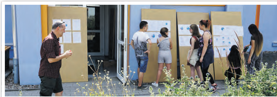
Der Kinder- und Jugendrat wertet die Jugend-Onlinebefragung aus.

Bereits in der Vorbereitung der Umfrage wurden die Vertreter/innen des Schwedter Kinder- und Jugendrates in die Konzeption mit einbezogen. Die Umfrage bestand aus 29 Fragen und konnte in ca. 20 Minuten anonym bearbeitet werden. Aufgabe des Kinder- und Jugendrates war es nun, die Tendenzen der insgesamt 194 Umfrageteilneh-