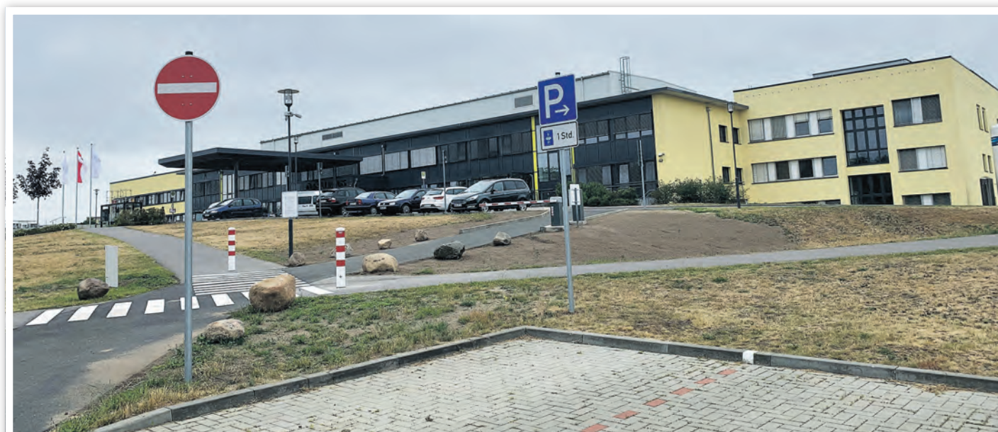
Zufahrt und Schranke zu kostenlosen Kurzzeitparkplätzen

Asklepios Klinikum Uckermark GmbH Am Klinikum 1, 16303 Schwedt/Oder ☎ 03332 530 ✉ Kontaktformular auf Internetseite www.asklepios.com/schwedt/