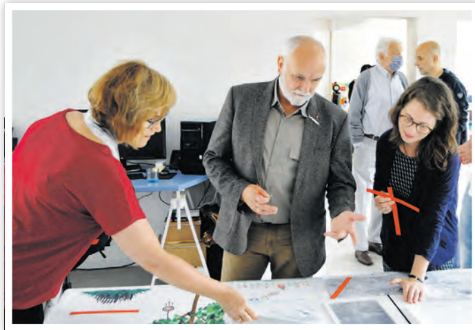
Jury-Mitglieder des Zeichenwettbewerbs sichten die eingegangenen Arbeiten