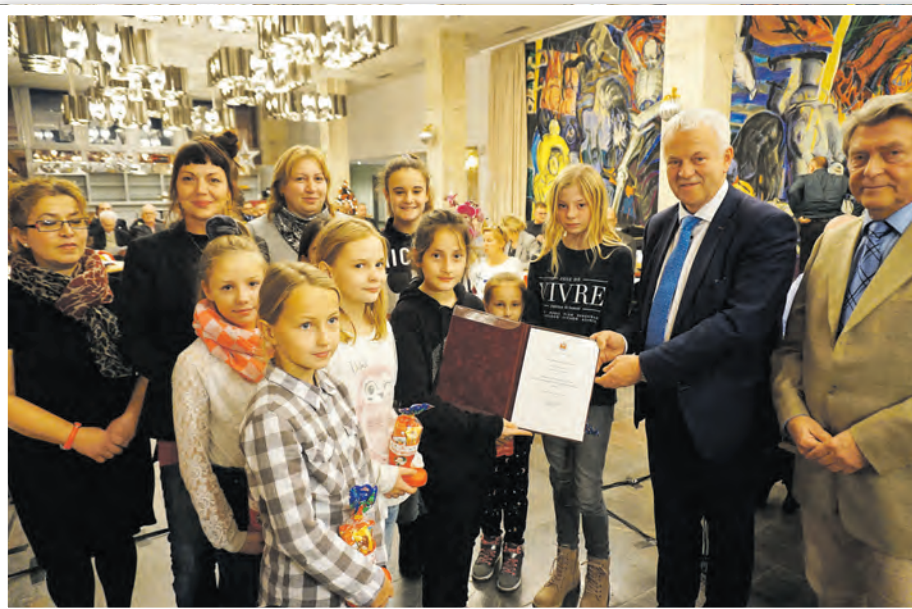
Der Mädchentreff erhielt für das Projekt „Gärtnern in der Stadt“ den Umwelt- und Naturschutzpreis 2018.

Eine Jury unter Vorsitz des Bürgermeisters wird anschließend alle eingegangenen Bewerbungen begutachten. Die Preisverleihung ist im Rahmen der öffentlichen Stadtverordnetenversammlung am 9. Dezember 2020 vorgesehen.