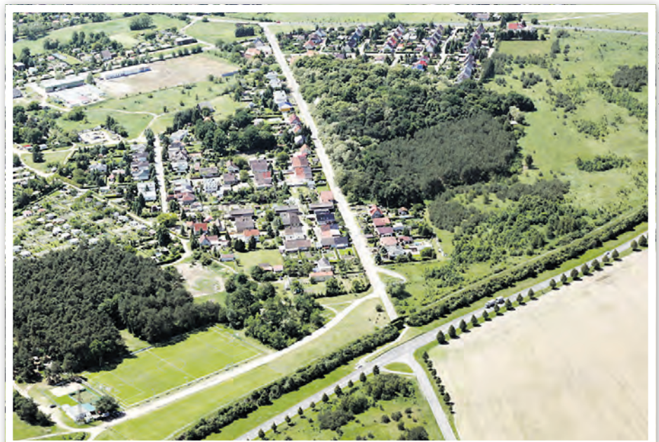
Die Hafenstraße im Vordergrund ist eine Umgehungsstraße für Vierräder.

Die Hafenstraße ist die einzige Erschließungsstraße für den Schwerlastverkehr zum Binnenhafen und zum Industriegebiet „Kuhheide“ mit den beiden Papierfabriken und weiteren mittelständischen Unternehmen. Die Fahrbahn war nach ca. 20 Jahren Nutzungsdauer erheblich geschädigt. Zu den Schäden zählten Alterungerscheinungen, Risse und Absackungen bis hin zu lokalem Zerfall und Schlaglochbildungen. Hauptursache ist die stetige Steigerung der Belastung durch