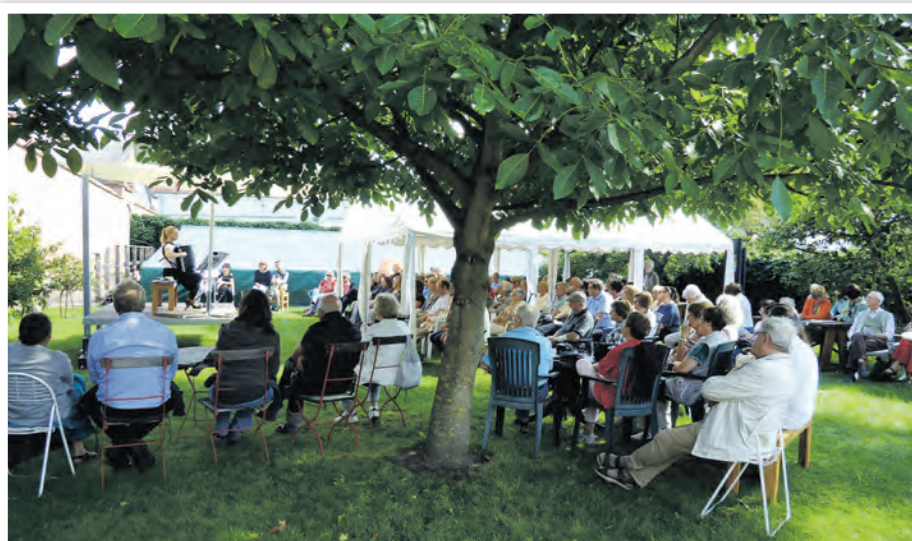
Gartenkonzert im Jüdischen Museum mit Ritualbad

Kartenservice und Informationen über den Veranstalter Uckermärkische Musikwochen e. V. (Tel: 0331 979 3301, E-Mail: info@uckermaerkische-musikwochen.de).