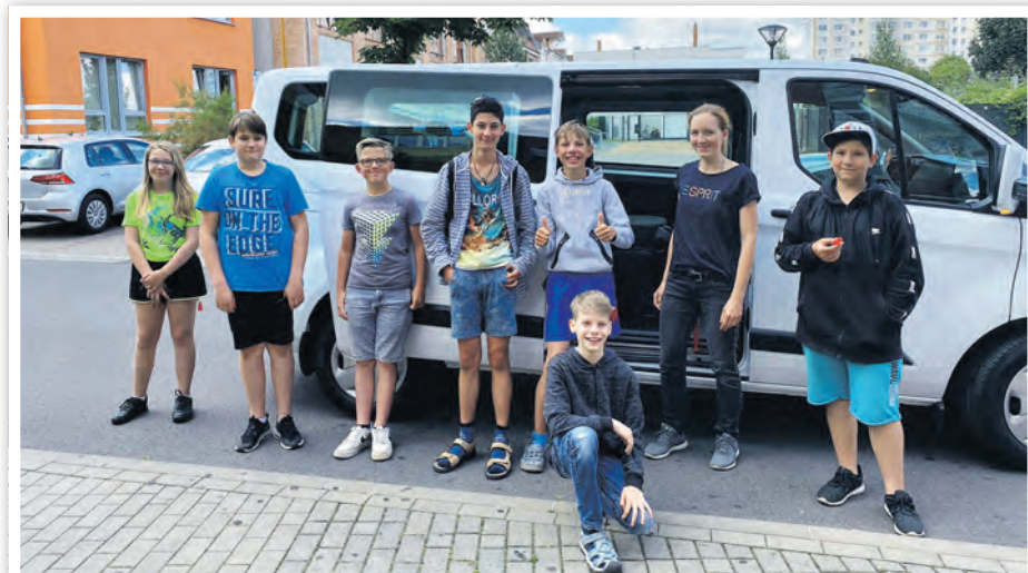
City-Mobil wurde vom Karthusclub eingeweiht.

Jugendclub Karthusclub e. V. Karthusstraße 5, 16303 Schwedt/Oder ☎ 03332 222-66 ✉ karthusclub@gmx.de www.karthusclub.de