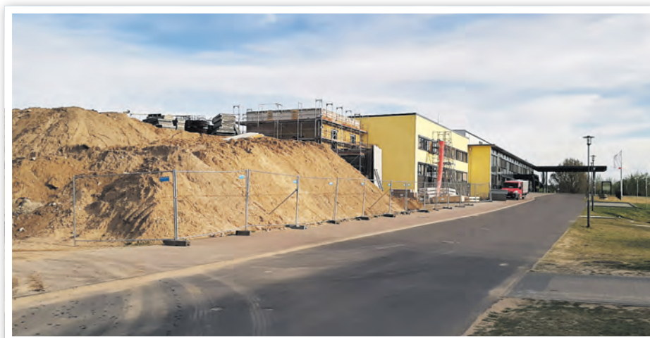
Baustelle: Hubschrauberlandeplatz und Notfallambulanz im April 2020