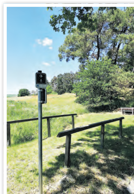
Wanderrastplatz bei Criewen