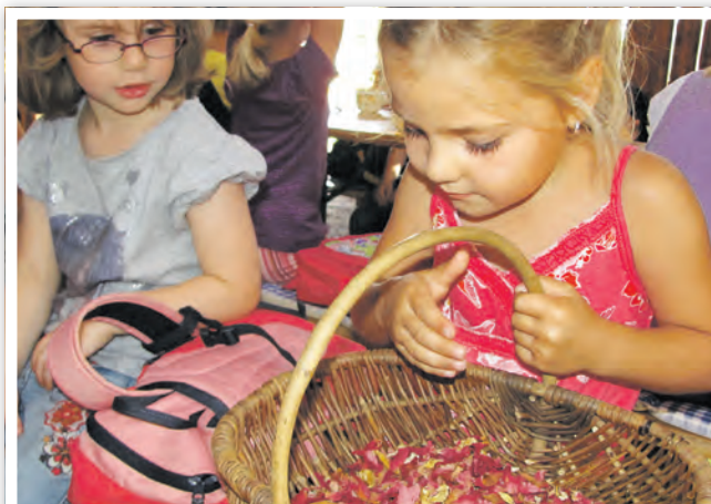
Kinder riechen an duftenden Rosenblättern

Tabakmuseum Vierraden Breite Straße 14, 16303 Vierraden ☎ 03332 250991 ✉ Kontaktformular auf der Internetseite Öffnungszeiten: Do. bis Fr. von 10:00 bis 16:00 Uhr, ab Juni auch Sa. und So. von 10:00 bis 17:00 Uhr virtueller Rundgang: www.ab-nach-schwedt.de/tabakmuseum www.schwedt.eu/tabakmuseum