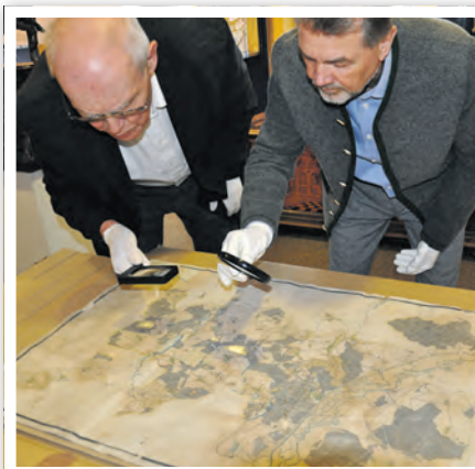
Historische Karte der Markgrafschaft Schwedt, um 1770.