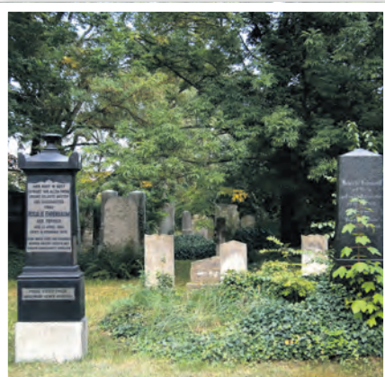
Blick auf den jüdischen Friedhof in Schwedt/Oder.

Am Mittwoch, dem 12. Januar 2022, um 15:30 Uhr laden die deutsch-polnischen Projektpartner zu einem kurzweiligen Filmworkshop in das Haus der Bildung in Schwedt, Raum 122 ein. Der Eintritt ist frei. Die Filmclips nehmen die Besucher auf eine Entdeckungsreise zu jüdischen Orten in Schwedt und Potsdam mit. Die jüdische Gemeinde in Schwedt hatte nach 1850 rund 200 Mitglieder und war damit nicht besonders groß oder klein, sie war nie herausragend und brachte auch keine bekannten Persönlichkeiten hervor. Die Besonderheit liegt heute darin, dass sich die Bauwerke der Schwedter Gemeinde außergewöhnlich gut erhalten haben. Die Nachwelt findet in Schwedt einen kulturellen Schatz. Mit den Stolpersteinen hat für Dagna Dombrowska, einer Schülerin des Gauß-Gymnasiums, die Forschung zum jüdischen Leben in der Oderstadt begonnen. Ihre filmische Reise führt über den jüdischen Friedhof bis zum ehemaligen Grundstück der jüdischen Gemeinde. Im zweiten Teil führt der Filmclip nach