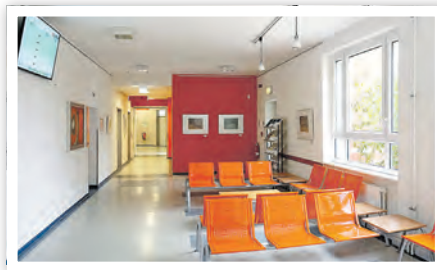
Wartebereich der Meldebehörde mit Aufrufanlage

Ist es wirklich dringend, bleibt nur der Montag zwischen 9 und 12 Uhr ohne Termin. An diesem Tag muss mit länge-