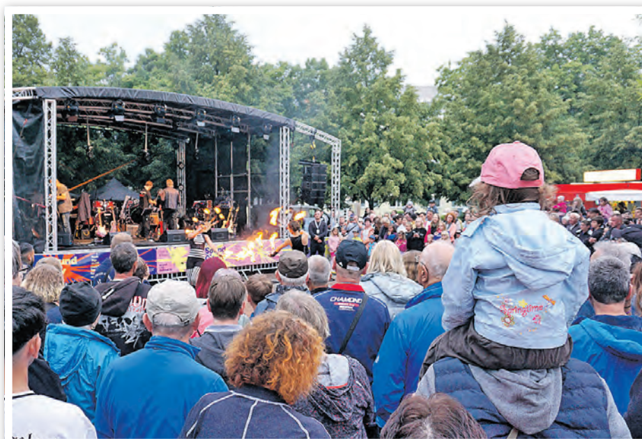
Feuershow bei der Mittsommernacht auf dem Alten Markt mit vielen Zuschauerinnen und Zuschauern

Wussten Sie, dass bei Veranstaltungen mit mehr als 5000 Gästen ein Sicherheitskonzept zu erstellen ist? Für Musik zwischen 22 und 6 Uhr muss eine Ausnahmegenehmigung vorliegen. Das Entzünden eines Lagerfeuers oder eines Feuerwerks bedarf ebenfalls einer Erlaubnis. Wer sorgt für Speisen und Getränke? Liegen dafür eine Reisegewerbekarte oder ein sogenanntes Gesundheitszeugnis vor? Wohin mit dem Abfall? Stehen ausreichend Toiletten zur Verfügung? Wo kann für die Veranstaltung geworben werden? Die öffentliche