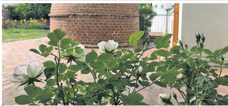
Der blühende Museumsgarten lädt zum Verweilen ein.

Tipp: Am Konzerttag findet auch eine Kulturtour mit dem Fahrrad statt. Die Tour beginnt am Bahnhof, führt u. a. ins Tabakmuseum, den Kunstspeicher in Vierraden, das Jüdische Museum Schwedt und endet mit dem Konzertbesuch. Anmeldung bis spätestens 18. August 2023 (und Kontakt für Rückfragen) unter E-Mail: tourismus@kulturfeste.de , Telefon: 0331-9793304.