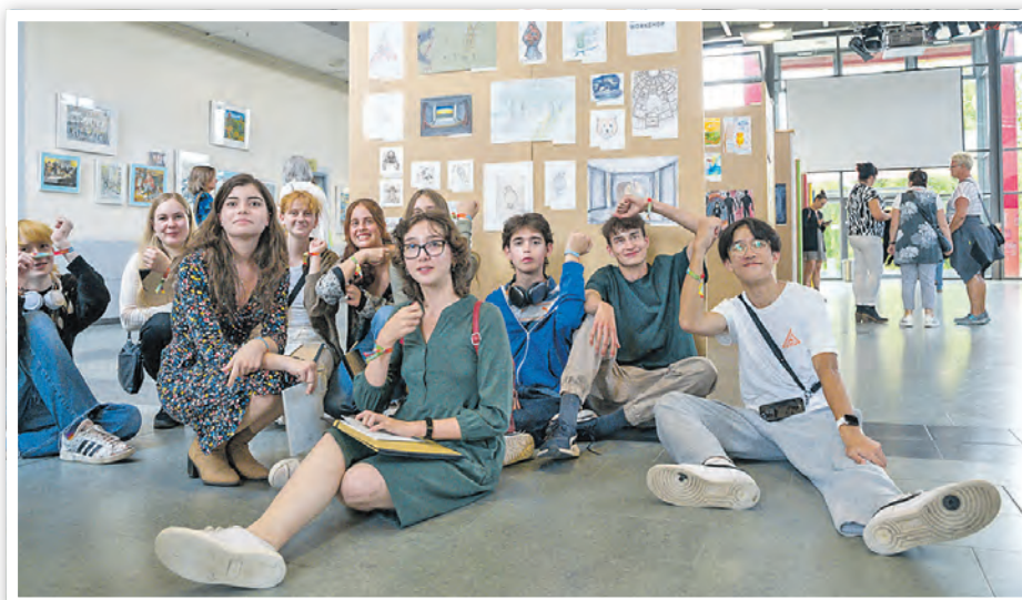
Das waren die Teilnehmer des diesjährigen Kunstcamps.

Am 11. Oktober eröffnete der Minister für Bildung, Jugend und Sport des Landes Brandenburg, Steffen Freiberg, eine