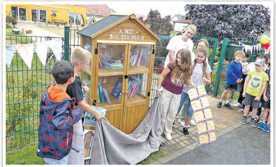
Der neue Bücherschrank vor dem Hort Oderstrolche wurde feierlich eröffnet.

kurzer Zeit beschädigt, worüber die Kinder und Erzieherinnen und Erzieher natürlich sehr traurig sind. Wir hoffen, dass der Bücherschrank bald wieder allen Kindern die Möglichkeit bietet, gelesene Bücher gegen andere Bücher auszutauschen.