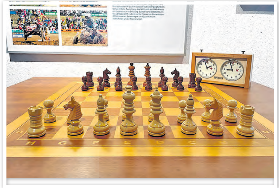
Ein originaler Schachschach der Olympiade steht aktuell im Stadtmuseum und lädt zu einer Partie Schach ein.

Übrigens erfreut sich in Schwedt der Schachsport traditionell großer Beliebtheit. Gleich drei Vereine bieten den Denksport an und messen die Kräfte z. B. in der jährlichen Mannschaftsmeisterschaft im Schnellschach. Ob die Sektion Schach beim TSV Blau-Weiß oder der Verein Schachclub Schwedt – immer geht es um Strategie und die Belohnung durch ein Schach-Matt. 1999 beschlossen zehn Schachspieler, noch einen weiteren Schachverein zu gründen: Der Verein „Schachfreunde Schwedt 2000“ war geboren. Im Gründungsjahr wurde mit drei Vierer-Mannschaften in der Kreisliga begonnen und 2001 bereits der