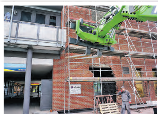
Im ehemaligen Iris-Pub am Oder-Center haben die Bauarbeiten für das „Neue Camp“ begonnen.

Am 23. April 2024 war offizieller Baustart, zum Jahreswechsel soll der Umbau fertig sein. Der kommunale Vermieter Wohnbauten Schwedt investiert in zentraler Lage am Bahnhof und Oder-Center mehr als zwei Millionen Euro in das neue Angebot für modernes Arbeiten. Neben Büros entstehen ein Foyer mit Sitzterrassen, ein Open-Spa-