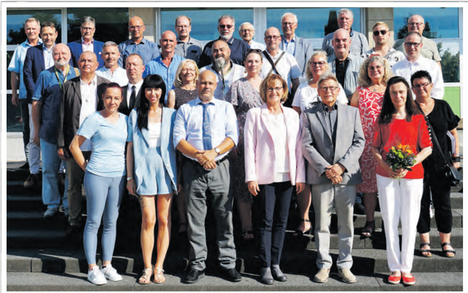
Mitglieder der Stadtverordnetenversammlung Schwedt/Oder für die Wahlperiode 2024 bis 2029

STADTVERORDNETENVERSAMMLUNG SCHWEDT/ODER