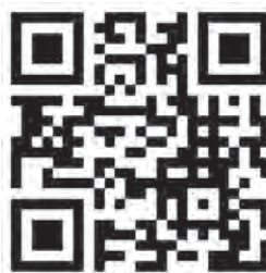
Die Leitlinie steht online zur Verfügung.

einem Strang ziehen, kann sich die Beteiligung von Kindern und Jugendlichen etablieren. Wünschenswert wäre es, wenn es nach ein paar Jahren zur völligen Selbstverständlichkeit wird, junge Menschen in allen Belangen, die ihre Lebenswelt berühren oder in Zukunft beeinflussen, einbezogen werden und wir darüber gar nicht mehr sprechen müssen.“