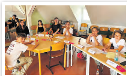
Ein Teil der Jury für das Kinder- und Jugendbudget.

Nachdem die Gruppen ihre Projekte vorgestellt hatten, folgte die Entscheidung im Kreis der Jury. Die Präsentationen reichten von einer Aufführung der