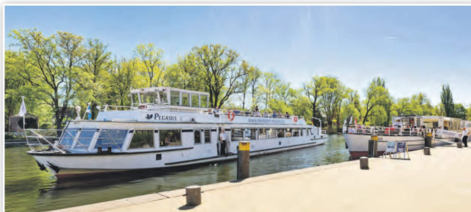
Anlegestelle der Fahrgastschiffe in Brandenburg (Havel)