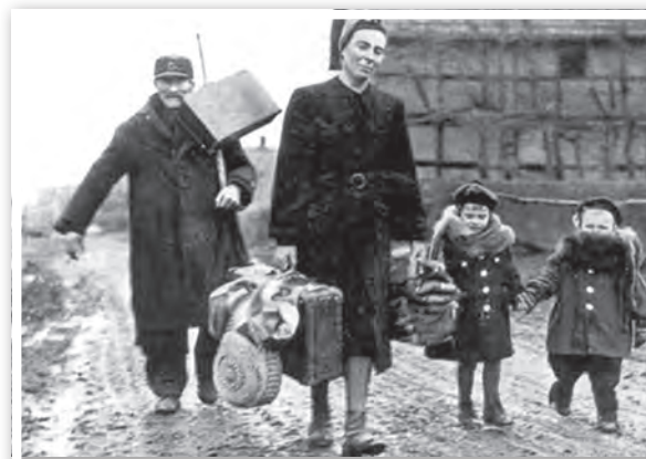
Ankunft im Lager Espelkamp, um 1949

Die Ausstellung zeigt den Weg von der Ankunft über die ersten Jahre durch die Wirtschaftswunderzeit bis hin zur Gegenwart. Die Veränderungen der gesamten deutschen Gesellschaft durch Flüchtlinge und Vertriebene in sozialen, konfessionellen und politischen Belangen werden ebenso präsentiert wie die Rahmenbedingungen, die dafür erkämpft wurden, seien es Rechtsstatus,