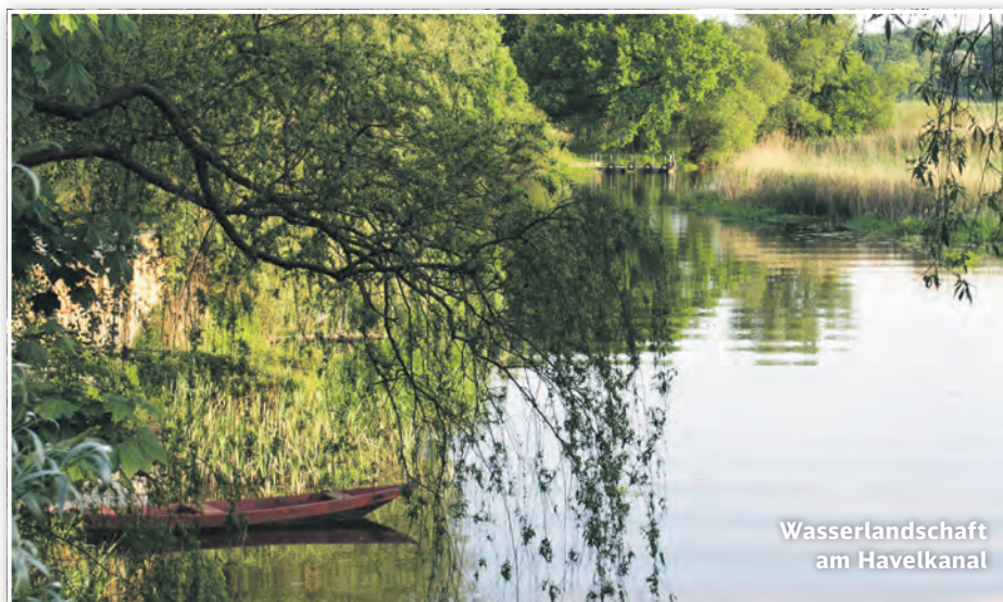
Wasserlandschaft am Havelkanal

Wenn noch etwas Zeit ist, sind auf der gegenüberliegenden Bahnhofsseite Spuren des historischen Stadtkerns zu finden oder es geht gemütlich durch den offenen Grünzug in der Hafestraße zum Ufer der Havel.