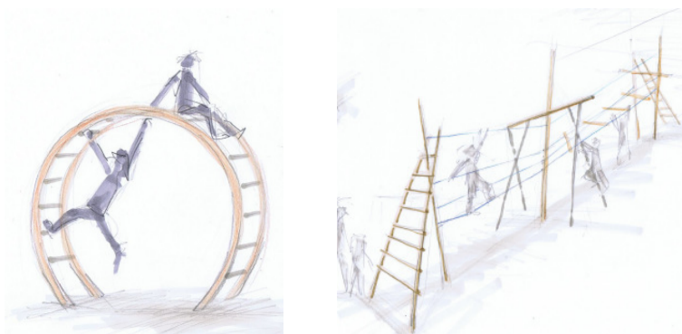
Kinderspiel aus Stahl mit Holz